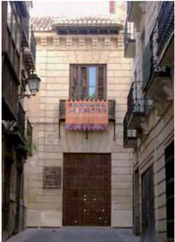
Casa de los Pisa, en Granada, donde murió acogido San Juan de Dios

Fundamentalmente la labor de esta Orden se centrará en la atención y el cuidado de los enfermos acogidos en los hospitales que van abriendo. También hubo hermanos que participaron, como enfermeros, en algunos conflictos bélicos; que formaron parte en expediciones hacia tierras americanas; que se hicieron presentes en situaciones de epidemias, pestes... Se conocen hermanos concretos que adquirieron un merecido renombre como cirujanos, otros como profesores de universidad, como administradores de centros.